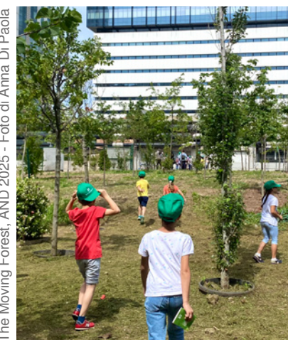
The Moving Forest, AND 2025

J.S. Anche se a volte siamo solo l'1% – come una piccola zanzara nella stanza