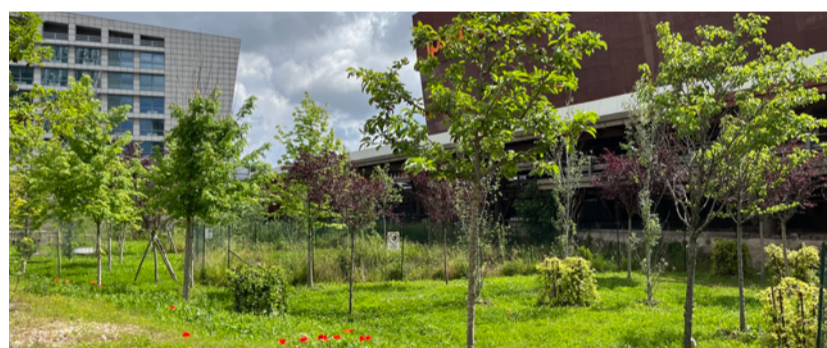
The Moving Forest

L'edificio sorge nel contemporary art district di eUrban, un luogo dinamico in cui lavoratori, residenti e visitatori si incrociano e si mescolano, avendo accesso a installazioni d'arte contemporanea e godendo di un'atmosfera stimolante e creativa. La prossimità tra gli spazi del lavoro e quelli dell'abitare, del tempo libero, dell'arte e della natura è, infatti, una caratteristica distintiva di EuroHive. Oltre all'attenzione alle tematiche di sostenibilità ambientale, sociale e di governance (ESG) e ai Sustainable Development Goals delle Nazioni Unite (SDG), EuroHive si contraddistingue per la Certificazione Well , l'unico standard riconosciuto a livello internazionale per la promozione della salute e del benessere nei luoghi di lavoro. Questo standard innovativo abbraccia 10 aspetti, alcuni fisici come l'aria, l'acqua, la nutrizione, la luce, il movimento, i materiali, il comfort termico e acustico, altri psicologici e sociali con diretta influenza sul benessere dei dipendenti nei luoghi di lavoro. Si tratta di un approccio olistico alla salute e al benessere, che incoraggia il design